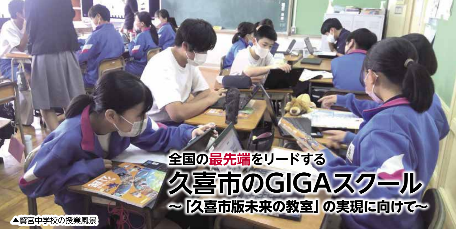
▲鷲宮中学校の授業風景