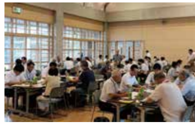
▲久喜コミュニティ推進協議会主催の防災勉強会の様子。区長・学校関係者・市役所職員等が地域の課題について意見を交わした。

問題を一人で抱え込むというのはとても大変なことです。でもつながりができていれば、誰かに相談して知恵を出し合って、道が開けるかもしれません。それに、人と人が顔を合わせると楽しいですね。つながりの場をつくるのが私たちの役目ですし、何かあっても最後に残るのは地域だと思っているので、これからも地域を見守り続ける立場でいたいと思っています。