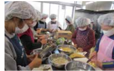
▲高齢者の安否確認も兼ねた配食サービスのボランティアの様子。献立づくりから入念に準備し、心を込めて調理している。

話を聞いてくれる人がいるだけで、たとえ解決にはつながらなくても、ちょっと心が楽になるものです。地域の住民が先に気付いて行動し、足りないところは行政や関係機関に相談して、一緒に一つの問題を解決していくことが大切ではないでしょうか。また、新しい住民の方もぜひ地域の行事などに参加していただき、「この地域でよかった」と思えるような場所になっていければと思います。