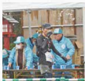
スポーツを「ささえる」

久喜市では、スポーツを通じて人を元気にし、まちを活性化させるため、今年3月に久喜スポーツコミッションを立ち上げました。コミッションのネットワークで連携してスポーツ振興に取り組み、一丸となって久喜市を盛り上げていきます。