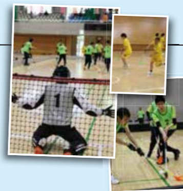
ラケットを巧みに使いこなす選手たちのハイスピードな試合展開。体験会も同時開催しました。

誘致 6月 ● スペシャルオリンピックス 日本・埼玉設立20周年記念 大会（フロアボール）