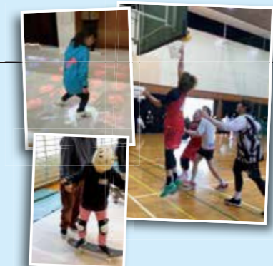
埼玉ワイルドベアーズの選手との3X3対決のほかに、スケボーやデジタルスポーツ体験を開催。