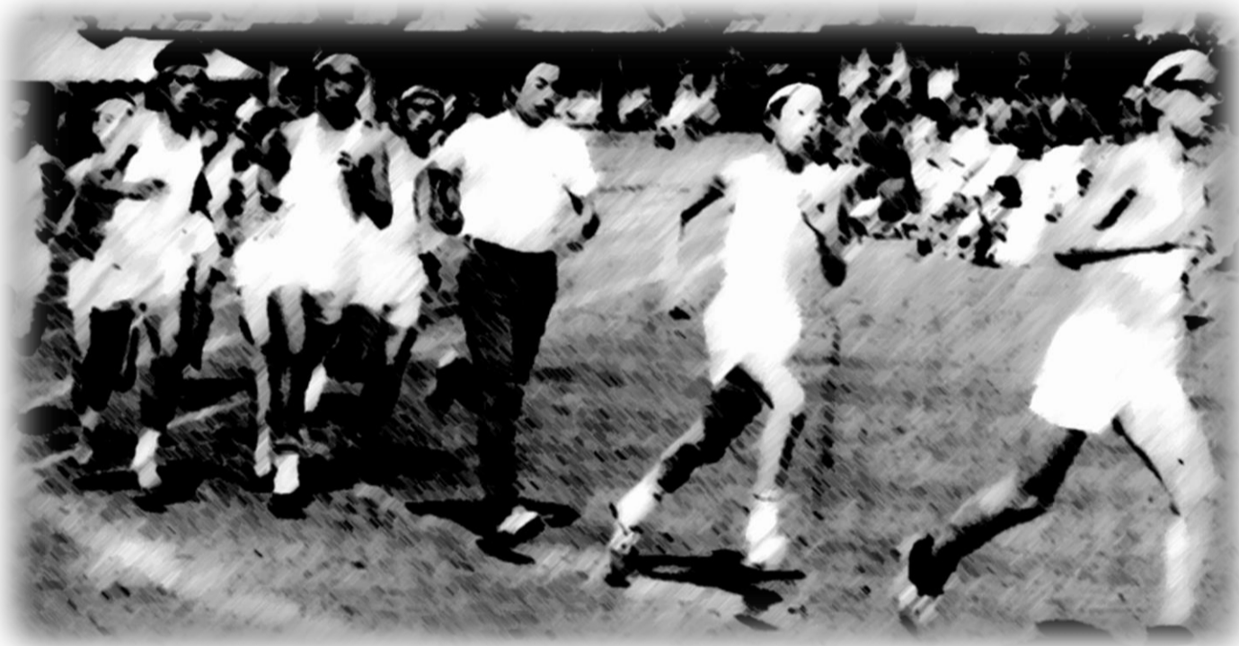
広報くき 昭和47年10月号表紙「スポーツの秋 各地にて運動会開かる」