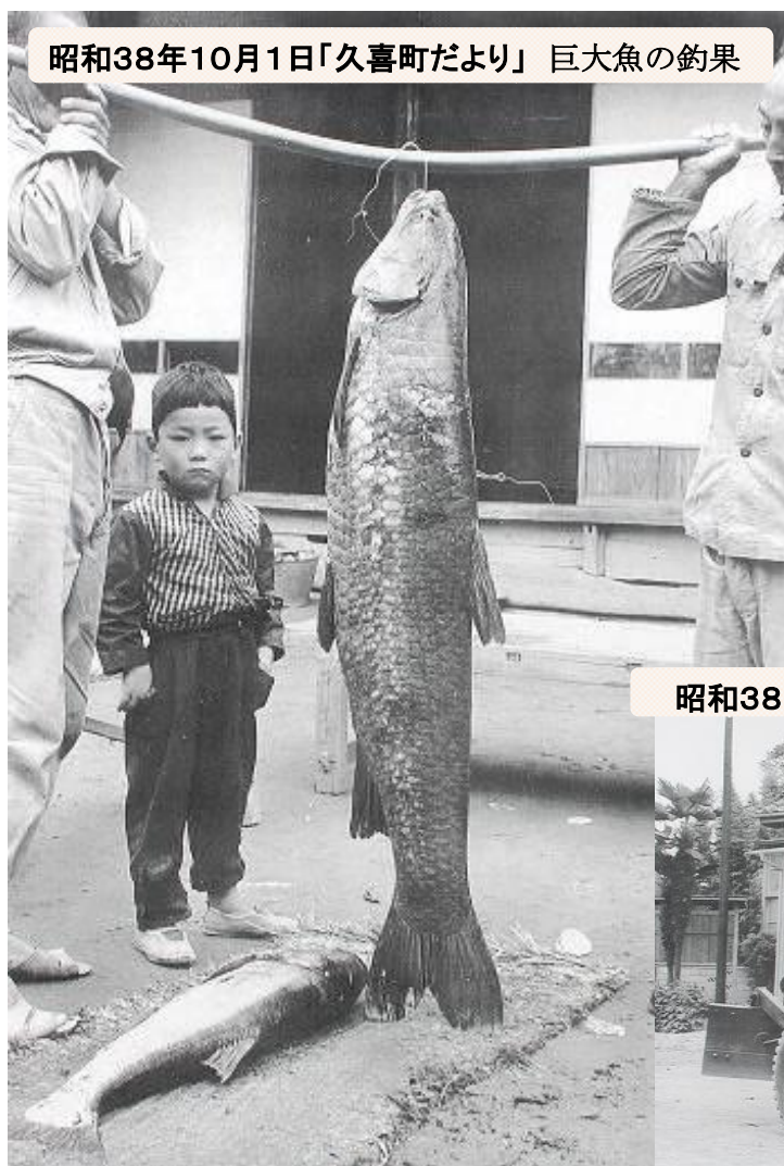
昭和38年10月1日「久喜町だより」 巨大魚の釣果