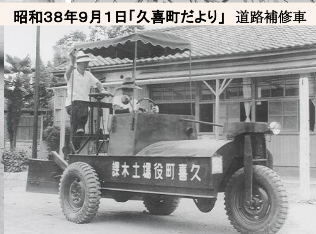
昭和38年9月1日「久喜町だより」 道路補修車