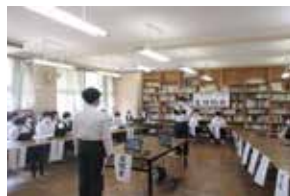
人権教育（オンライン生徒会総会）

◇関連するSDGsの主なゴールとターゲット 「5年後のまちの姿」の実現により達成されるSDGsの主なゴールとターゲットを示します。 なお、ゴール17のターゲット17は、すべての施策に共通するものと考え、ここには示さず、「協働・共創のまちづくり *1 指針」（次頁右上）で位置付けます。